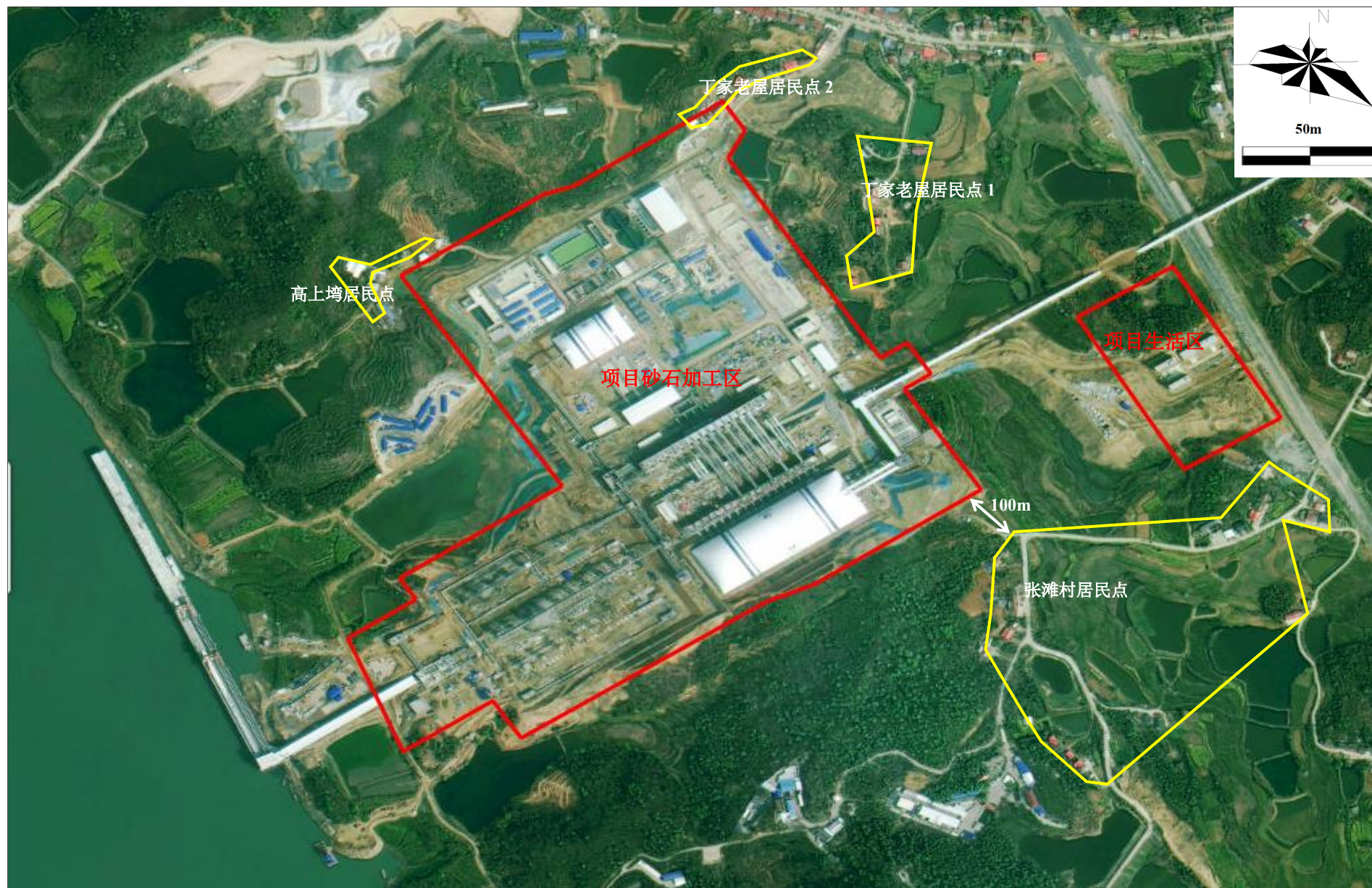
附图 2 项目周边关系示意图