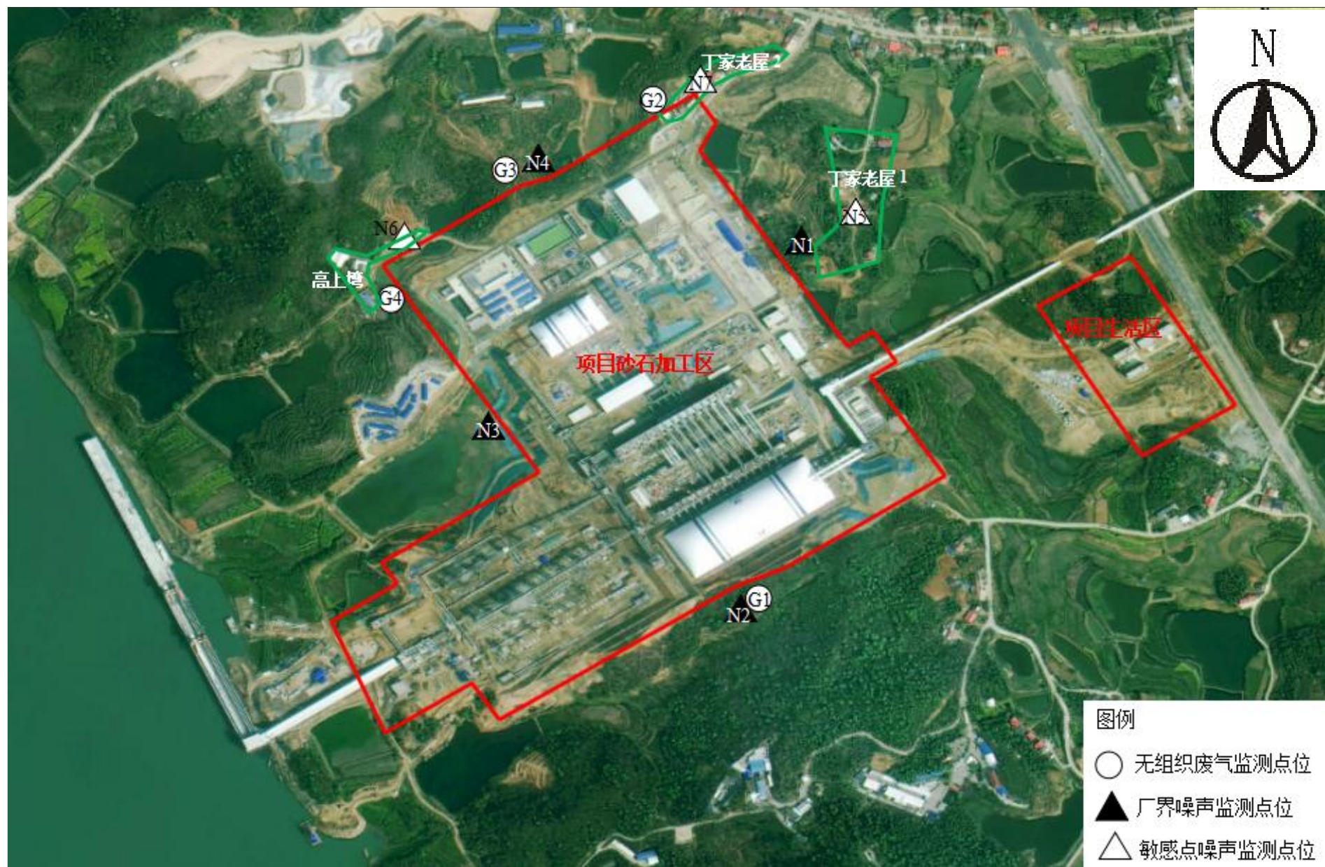
附图 4 项目验收监测点位图