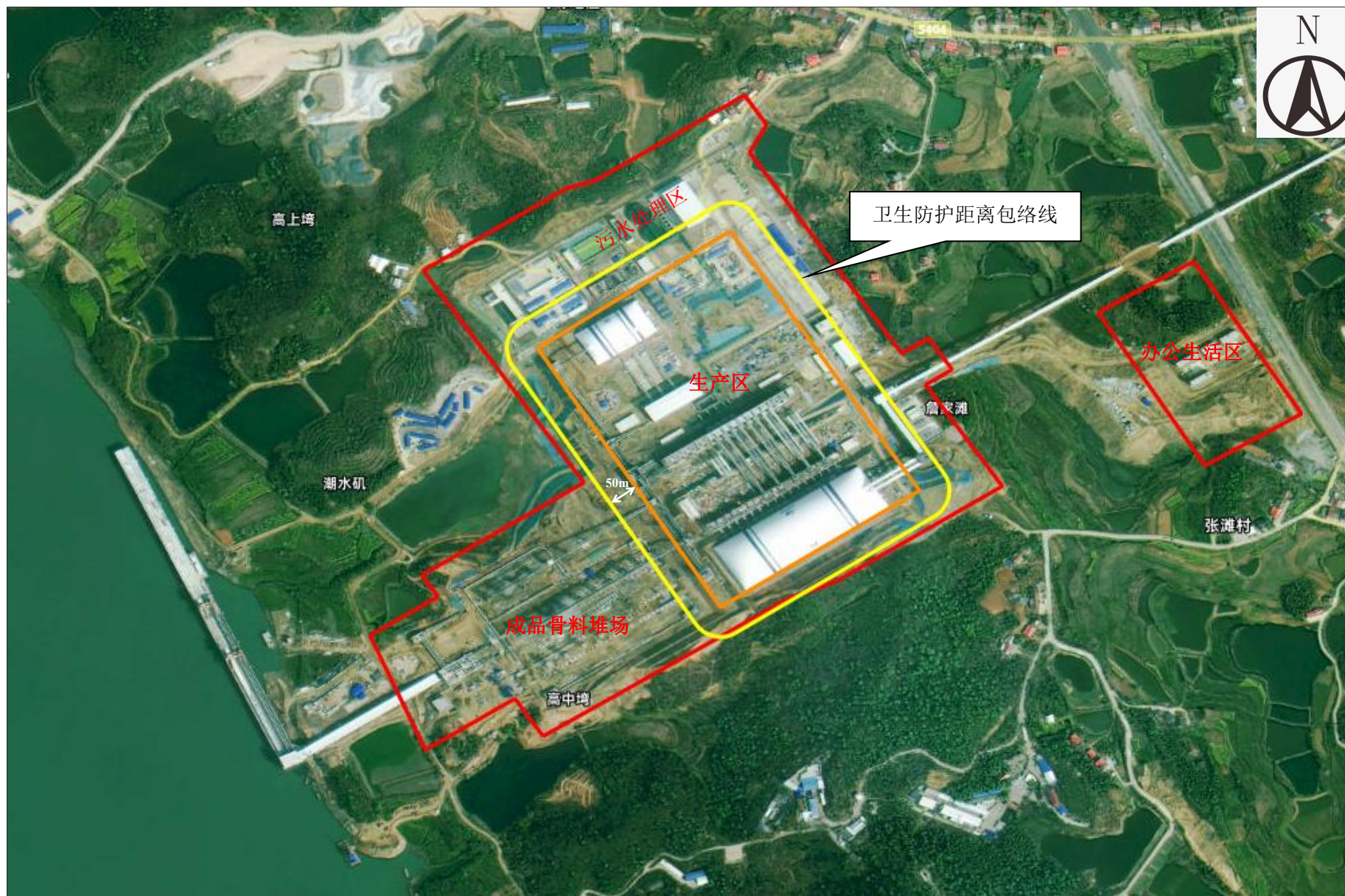
附图5 项目卫生防护距离包络线图